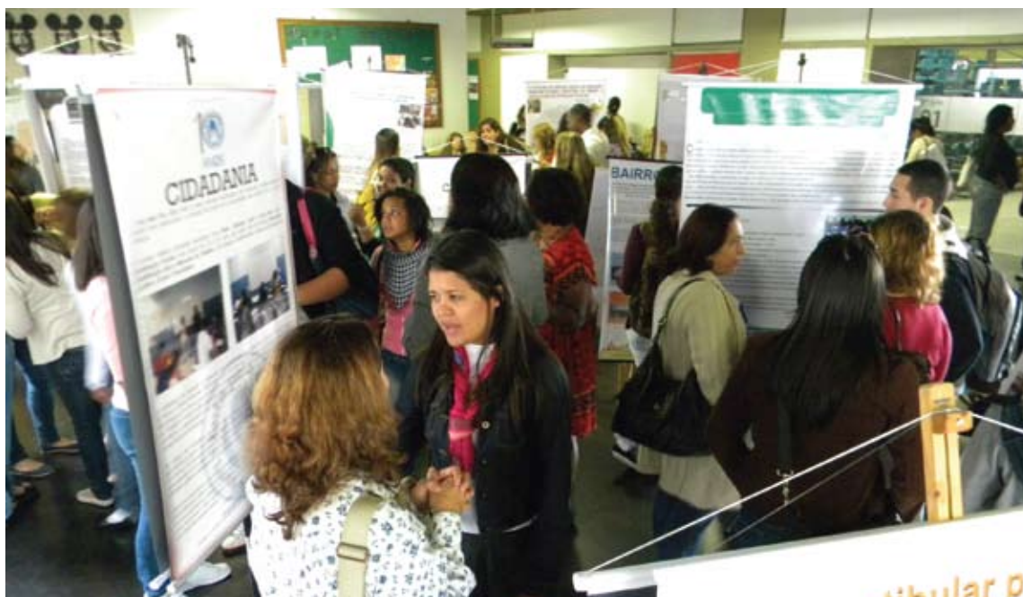
O evento contabilizou a exposição de 32 posters

O VI Encontro Estadual de Serviço Social e Educação possibilitou à Comissão de Educação do CRESS-RJ efetivar importantes articulações com profissionais que trabalham e militam no campo da educação nos diversos municípios