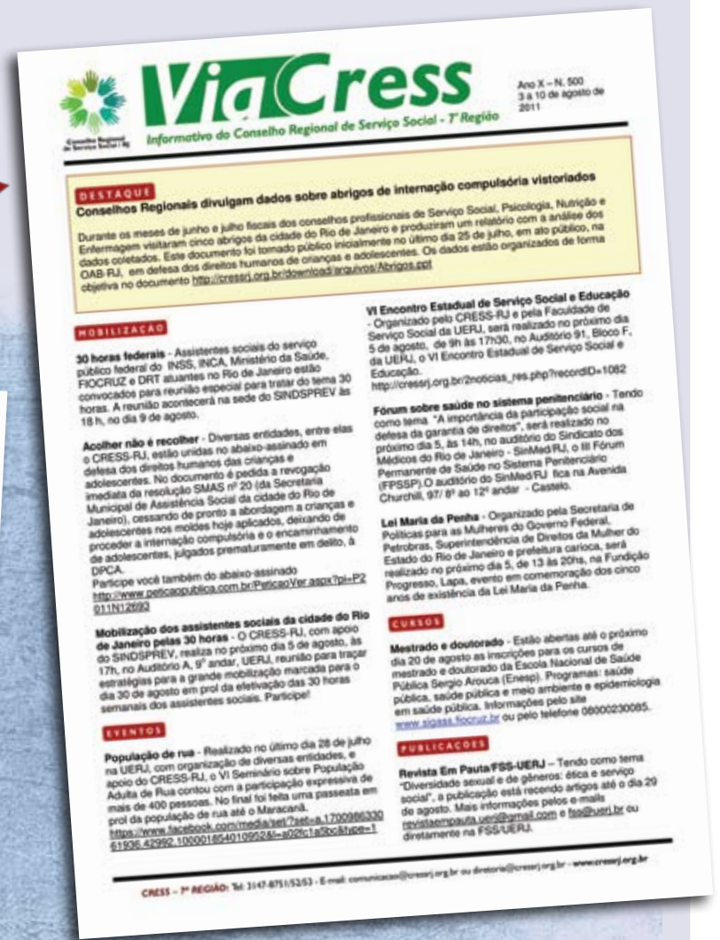
Visual arejado com identificação dos temas através de ícones são as características do novo Via Cress

A mpliar o contato com a categoria através de diversos meios de comunicação tem sido um dos principais objetivos do Conjunto CFESS/CRESS e do CRESS-RJ. O dvd distribuído na edição 59 do Praxis serve como constatação de acúmulo deste esforço.