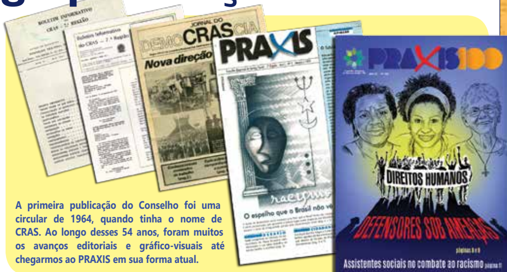
A primeira publicação do Conselho foi uma circular de 1964, quando tinha o nome de CRAS. Ao longo desses 54 anos, foram muitos os avanços editoriais e gráfico-visuais até chegarmos ao PRAXIS em sua forma atual.

O PRAXIS é um dos instrumentos políticos destinados a fortalecer e potencializar a comunicação do CRESS com a categoria e a sociedade. Assim, faz uso de estratégias e informações que reafirmam o projeto ético-político profissional. Destacamos também que é um veículo que prima pelo uso de uma linguagem não discriminatória em suas publicações, além de privilegiar o emprego da linguagem de gênero,